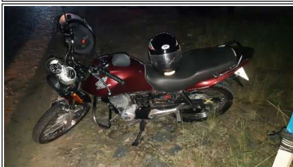
IMAGEM DA LATERAL ESQUERDA