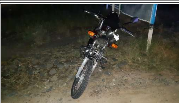
IMAGEM DA FRENTE