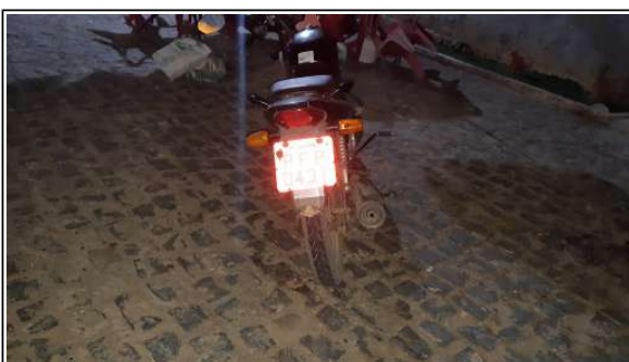
IMAGEM DA TRASEIRA