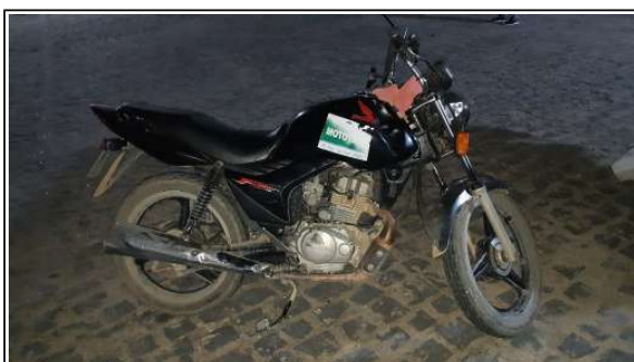
IMAGEM DA LATERAL DIREITA