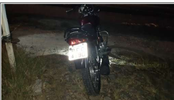
IMAGEM DA TRASEIRA