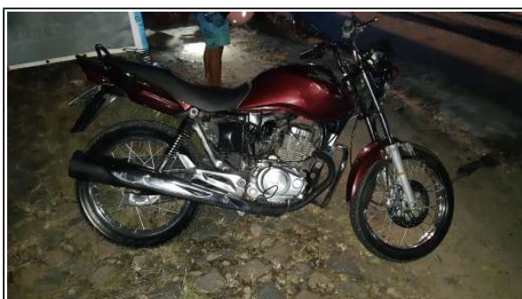
IMAGEM DA LATERAL DIREITA