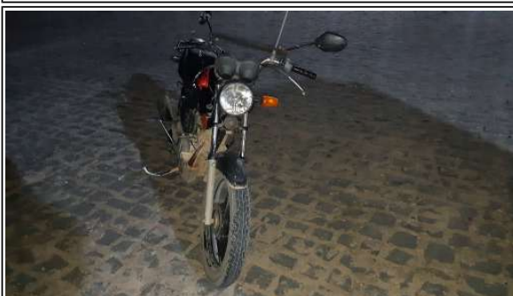
IMAGEM DA FRENTE