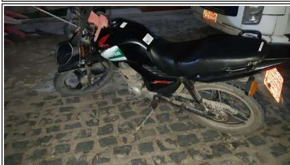
IMAGEM DA LATERAL ESQUERDA