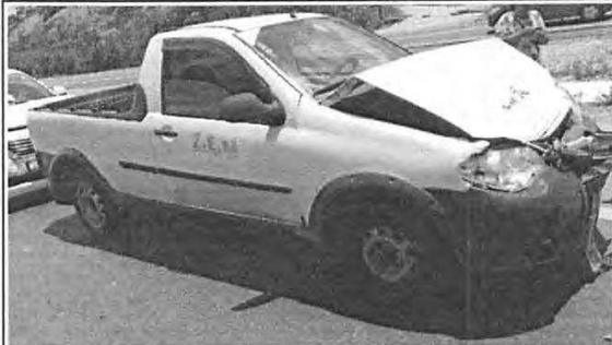
IMAGEM DA LATERAL DIREITA