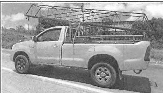
IMAGEM DA LATERAL ESQUERDA