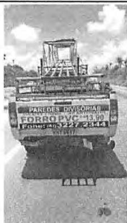
IMAGEM DA TRASEIRA