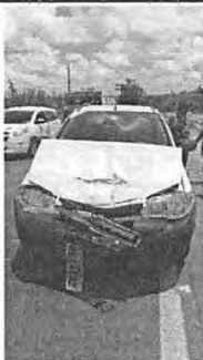
IMAGEM DA FRENTE