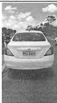
IMAGEM DA TRASEIRA