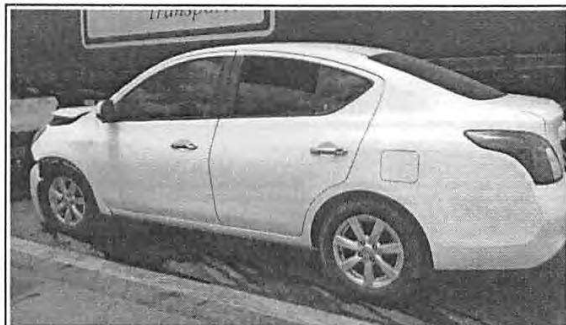
IMAGEM DA LATERAL ESQUERDA