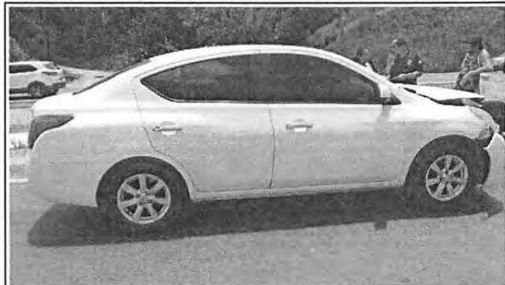
IMAGEM DA LATERAL DIREITA