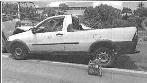
IMAGEM DA LATERAL ESQUERDA