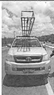
IMAGEM DA FRENTE