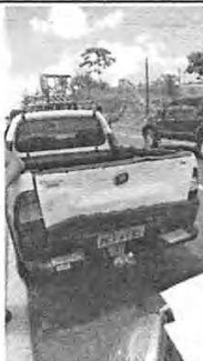
IMAGEM DA TRASEIRA