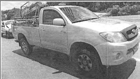
IMAGEM DA LATERAL DIREITA