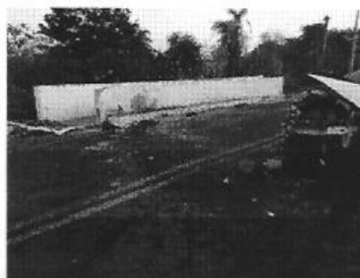
IMAGEM COMPLEMENTAR 02