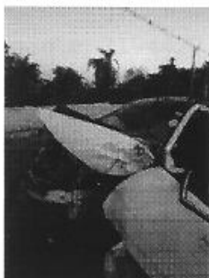
IMAGEM COMPLEMENTAR 01