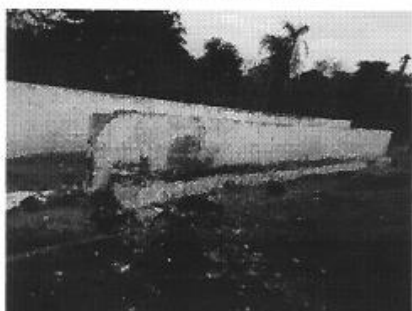
IMAGEM COMPLEMENTAR 03