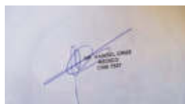
Rangel Inácio da Cruz - CRM: 7537 - PB

Trauma recente em processo de reabilitação.